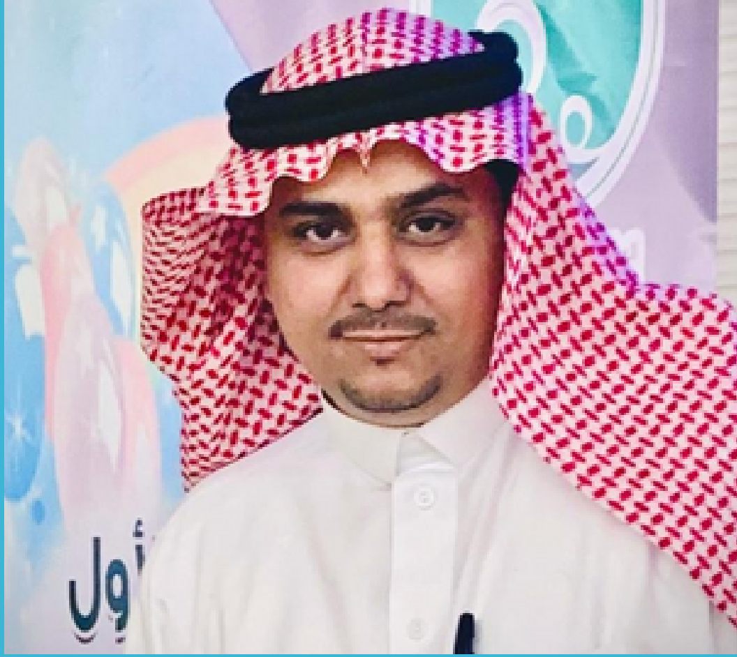
محوشي رئيس لفرع الجمعية السعودية للطب الوراثي بالمنطقة الجنوبية