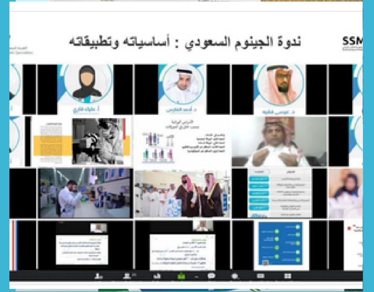
الجمعية السعودية للطب الوراثي تسلط الضوء على أساسيات وتطبيقات الجينوم السعودي