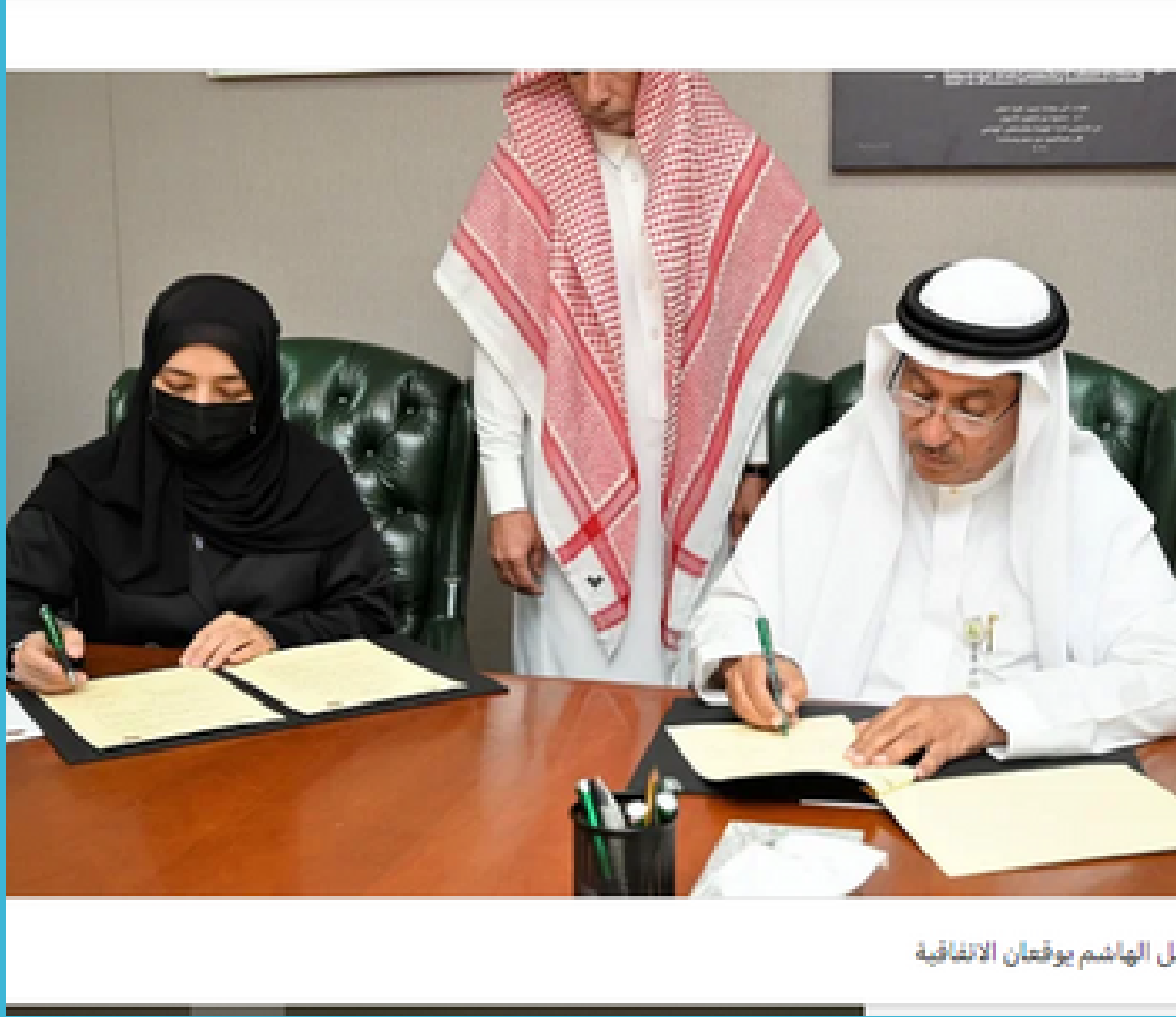
مل الهاسم يوقعان الاتفاقية

أغسطس 2022 "الطب الوراثي" توقع اتفاقية لتعزيز العمل المشترك مع كلية الطب بجامعة المؤسس تستهدف الارتقاء بمستوى الخدمات الطبية في هذا التخصص