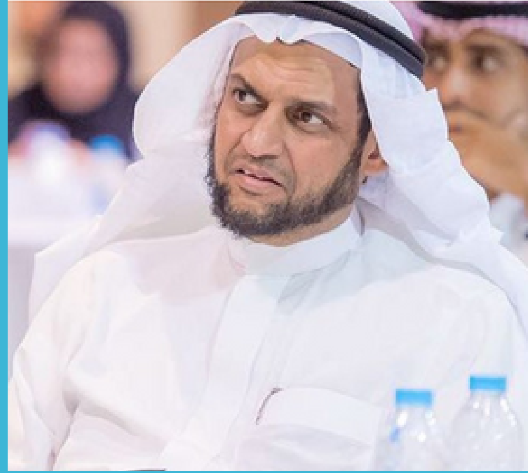
بالتعاون مع جمعية بصمة بهدف التوعية بالامراض الوراثية الجمعية السعودية للطب الوراثي تنفذ ندوة " الإعاقات السمعية و البصرية"